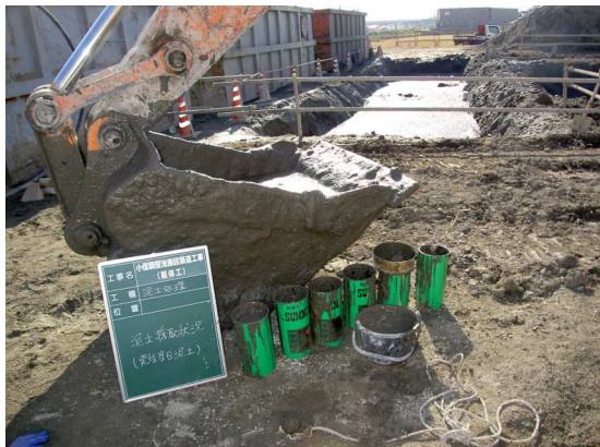
写真-1 TRD工法排泥採取状況

TRD工法排泥の硬化特性を調べるため、コーン指数試験を行った。試料は、写真-1に示すように排泥ピットからバックホウを用い採取し、これを9.5mmふるいで分級し、通過した試料を実験試料とした。供試体の作成と養生方法は、実験試料をφ10cm、H30cmの二つ割りサミットモールドに流し込み、高さ20cmまで満たし、サミットモールドをラッピングし密閉した後、室内温度10℃で空気養生した。養生期間は4~5週間とし、養生後、締固めた土のコーン指数試験法（JIS A 1228）に準拠しコーン指数を把握した。なお、排泥の採取は数日に分けて行い計5供試体作成した。